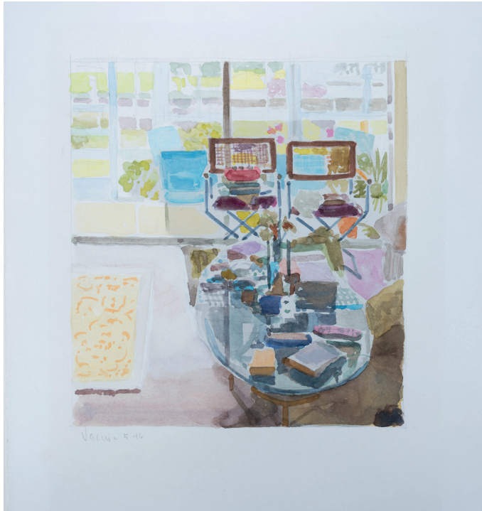
Spanish River 2019 Tusche auf Papier, gerahmt 37x27 cm Galeriepreis: 800,00 Euro