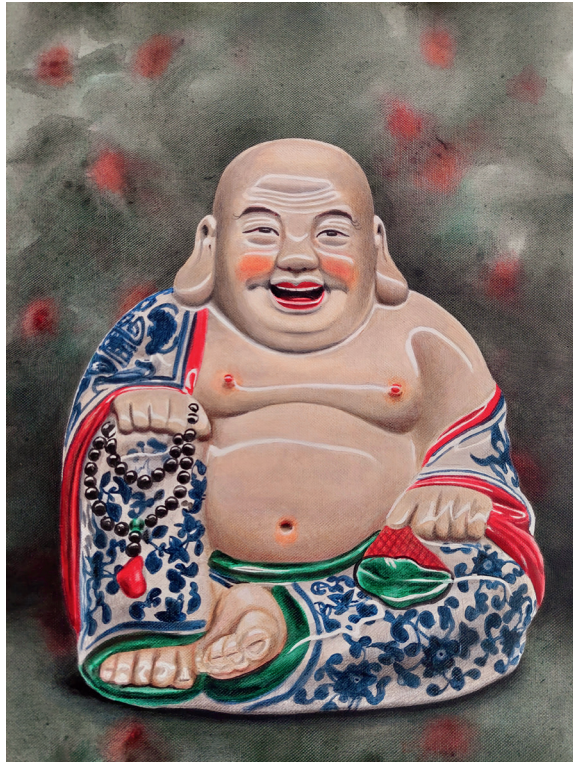
Buddha VII 2024 Acryl auf Leinwand, 50x 38 cm Galeriepreis: 1800,00 Euro