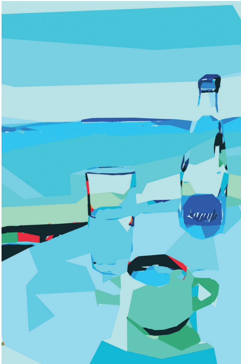
Coffeetime 2022 Inkjetprint auf Leinwand 120x 80 cm Unikat Preis: 1500,00 Euro